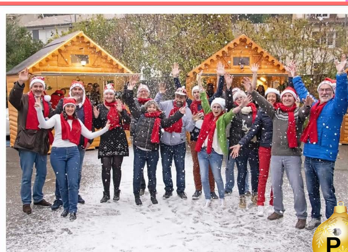
Marché de Noël - Mondragon 2022