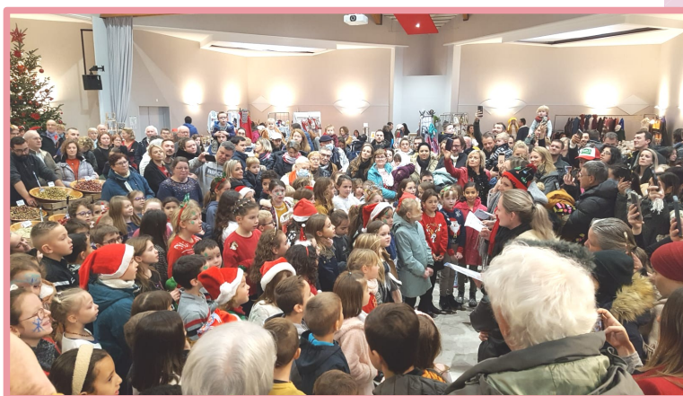
La chorale de Noël, guidée par les maîtresses de l'école

Côté emplettes, 45 stands avec des créations artisanales ont su contenter les visiteurs. Pour les plus jeunes, une aire de jeu gonflable, un sculpteur de ballons et une maquilleuse étaient présents, sans oublier le Père Noël qui s'est arrêté toute la journée au village pour accueillir les enfants dans sa maison. La restauration sur place était assurée par le comité des fêtes avec sa traditionnelle choucroute et son vin chaud, accompagné du Sou des écoles et ses crêpes et des hot-dogs du Jardin des lutins. Enfin l'animation de la journée a été ponctuée par des chorégraphies sportives ainsi qu'une démonstration de country par les sections du Foyer des jeunes et, cadeau sous le sapin, le match des Bleus diffusé sur écran géant !